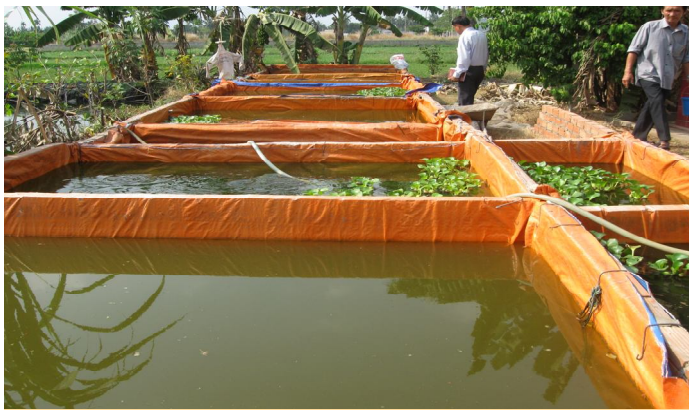
Hệ thống ao ương nuôi

+ Bể đẻ là hồ xi măng, đáy bằng phẳng và không có vật nhọn. Diện tích 2,5 x 5 x 1,2 m, giăng lưới xung quanh bên trong để dễ thu gom cá bố mẹ sau khi sinh sản và tiện cho việc theo dõi cá sinh sản. Mực nước cấp vào bể đẻ ban đầu khoảng 0,5 m và phải lấy trước 2 ngày.