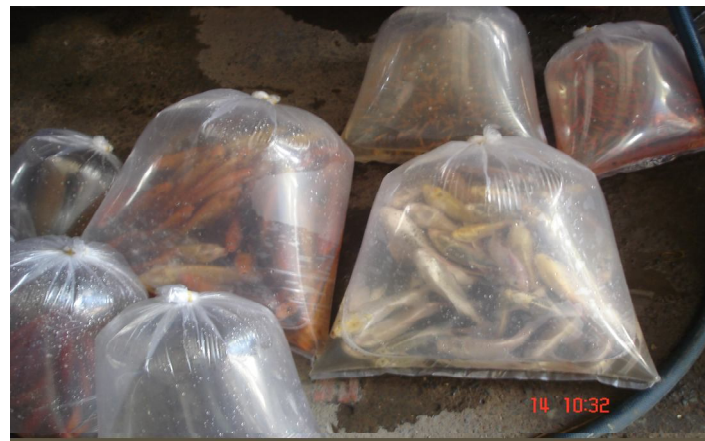
Đóng bao xuất bán

- Theo kinh nghiệm, trong quá trình ương nuôi 4 - 6 tháng nên sang cá ra các ao khác từ 1 - 3 lần, cá sẽ mau lớn, khỏe mạnh và có màu sắc đẹp.