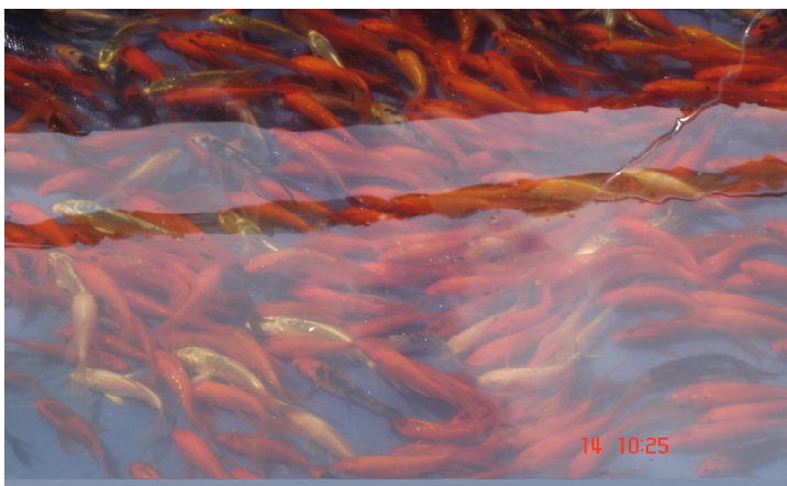
Cá thương phẩm

- Khi cá được khoảng 4 - 6 tháng tuổi, bắt đầu phát triển kỳ, vây theo kiểu dáng, màu sắc đặc trưng của cá là có thể thu hoạch để bán.