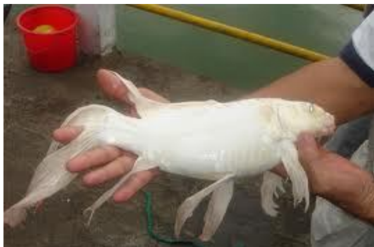
Cá chép đuôi dài