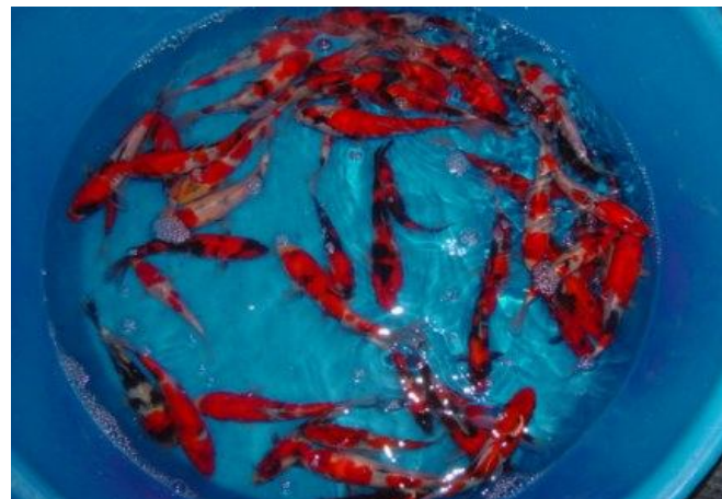
Cá Koi thương phẩm