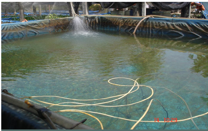
Bể xử lý nước