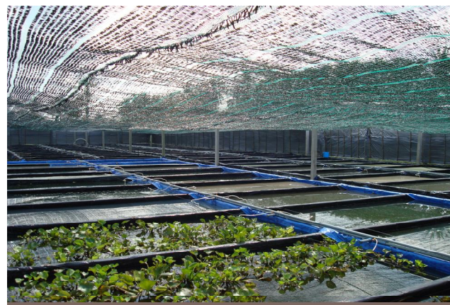
Hệ thống ao ương nuôi

+ Cá chép Nhật là loài cá đẻ trứng dính trên cây cỏ thủy sinh nên giá thể là rất cần thiết. Có thể chọn bèo lục bình: vệ sinh sạch sẽ, ngắt bớt phần lá và rễ già để tạo chùm rễ thông thoáng, nên chọn phần rễ 30 cm, phần thân 20 cm là tốt nhất, ngâm vào nước muối 5% để sát trùng, loại bỏ kí sinh trùng khác.